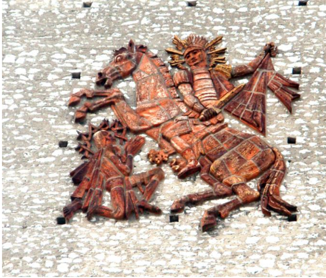
Cattedrale di Tours